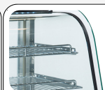
Double vitrage pour réduire toute dispersion