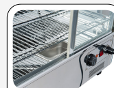
Socle en acier inoxydable